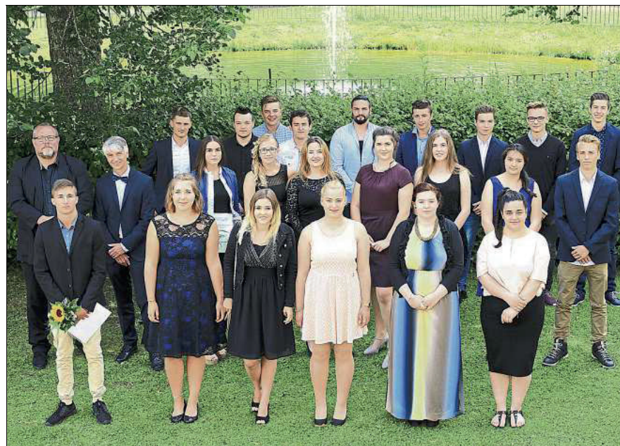
Die zehnte Klasse der Werkrealschule (links) und die jungen Leute der Berufsfachschule haben die Mittlere Reife in der Tasche.