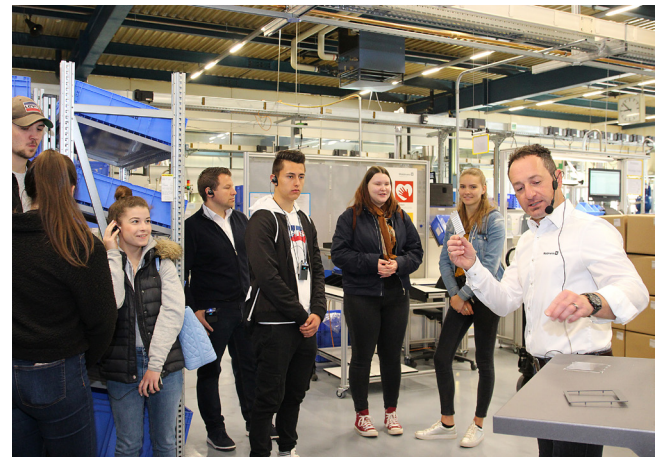
Bei einer Exkursion zum Leuchtenhersteller Waldmann konnten die Schülerinnen und Schüler erfahren, wie SAP eingesetzt wird.