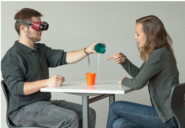
Praktische Experimente machen den Unterricht besonders nachvollziehbar.

Im Profilfach Volks- und Betriebswirtschaftslehre am Wirtschaftswissenschaftlichen Gymnasium (WGW) befassen wir uns zum Beispiel mit folgenden Themen und Fragen: