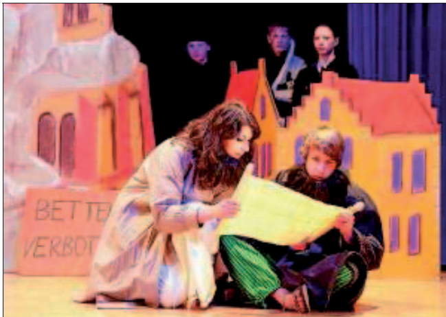
Theater spielt an den Zinzendorfschulen schon immer eine große Rolle. Vom kommenden Schuljahr an ist an den Gymnasien Literatur und Theater nicht nur als Arbeitsgemeinschaft, sondern auch als Schulfach möglich.

Ebenfalls an den Eingangsklassen der beruflichen Schulen wird das selbst organisierte Lernen verstärkt. In einer Stunde pro Woche arbeiten die Schüler in bestimmten Fächern einen vorgegebenen Wochenplan ab. Damit sollen sie an selbstständiges Arbeiten gewöhnt werden, wie es später in Beruf und Studium erforderlich ist.